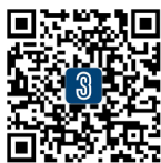
3S INDUSTRY 公众号