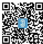
3S LIFT 公众号