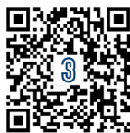
3S INDUSTRY 官网